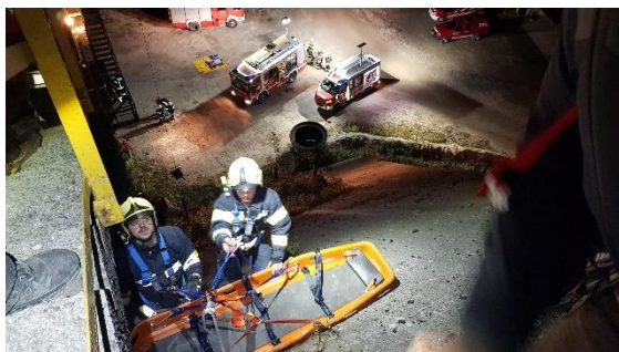
15.12.2023 Verkehrsunfall B145 Sternberg