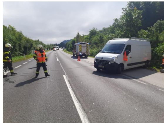
27.09.2023 Verkehrsunfall B145 Sternberg