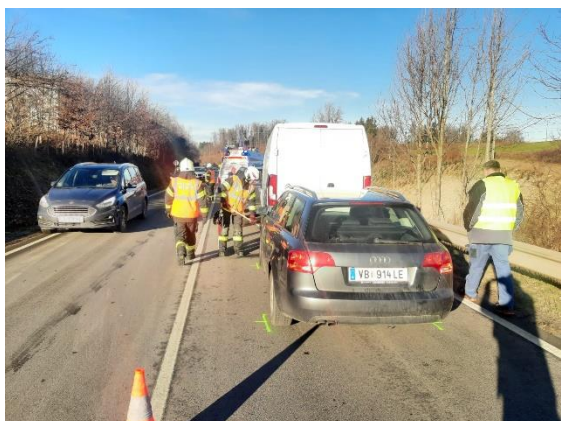
22.12.2023 Sturmschaden Gmundnberg