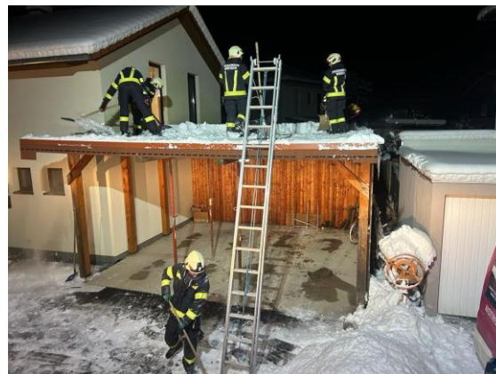
10.11.2023 Übung mit Bergrettungsdienst