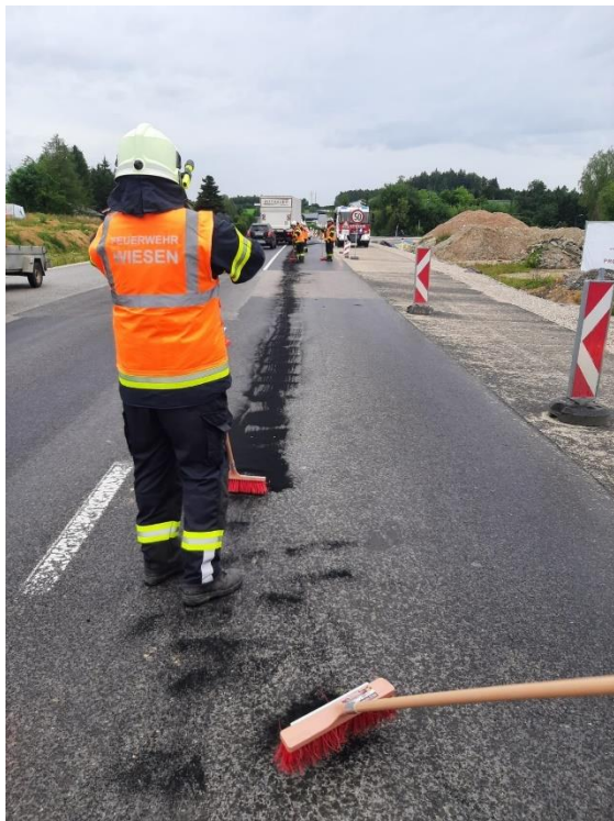
20.08.2023 Verkehrsunfall B145 in Wiesen