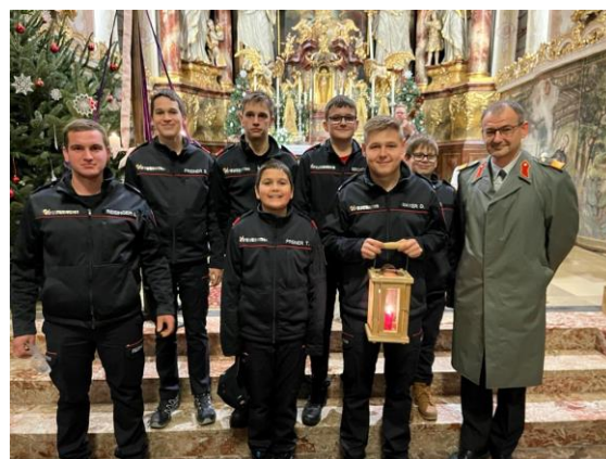
23.12.2023 Weihnachtsstand in Wiesen