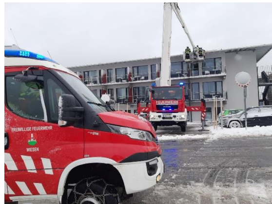
2023.12.23 Friedenslichtübergabe Traunkirchen