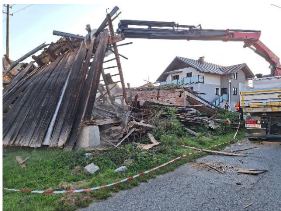
30.09.2023 Verkehrsunfall B145 Sternberg